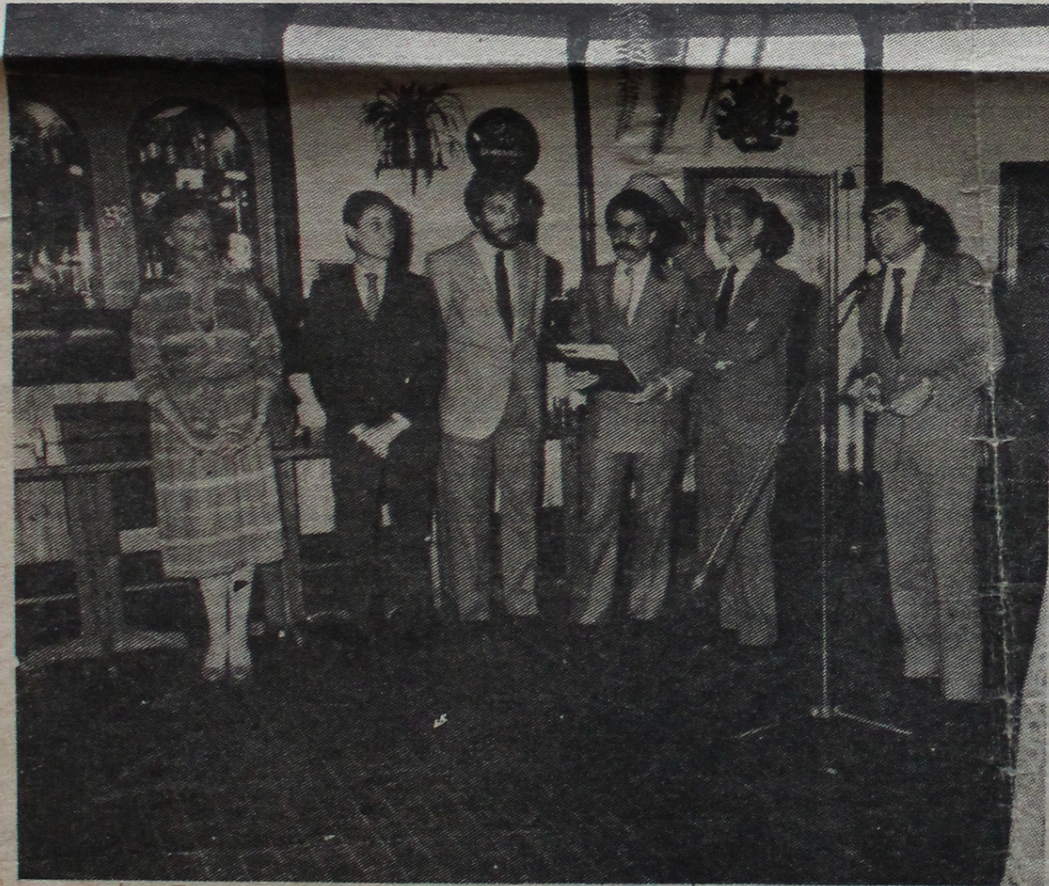
Funcionarios consulares de Sudáfrica informaron sobre la realización del congreso

El secretario ejecutivo del agrupamiento señala que "se ve obligado a condenar y desautorizar ante la opinión pública a este grupo divisionista y hace un fervoroso llamado al conjunto de los genuinos familiares a seguir unidos y estrechar filas por nuestros humanos y sentidos objetivos: aparición con vida de los detenidos-desaparecidos y esclarecimiento de las acciones represivas que lo provocaron; la libertad de todos los detenidos políticos y gremiales; levantamiento del estado de sitio; desmantelamiento del aparato represivo y derogación de la frondosa legislación represiva, consignas que venimos sosteniendo desde hace más de seis años".